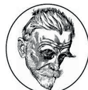
Ίδρυμα Κωστή Παλαμά

ΠΑΝΕΠΙΣΤΗΜΙΟ ΑΙΓΑΙΟΥ UNIVERSITY OF THE AEGEAN Παιδαγωγικό Τμήμα Δημοτικής Εκπαίδευσης